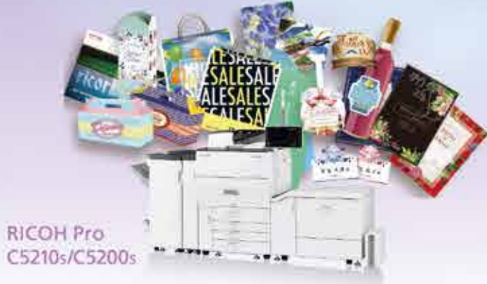
RICOH Pro C5210s/C5200s